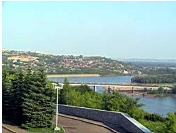
Река Белаја недалеко од Уфе

име. На јужном Уралу на 227 m надморске висине лежи језеро Ирџаш површине 53,5 km 2 и дубине до 18 m. Из тог језера истиче река Теча (315 km), десна притока исета (505 km) у сливу Оба (3.650 km). Око 580 km североисточно од изворишта Тече је река Кума (530 km), десна притока Конде (1.037 km), која је лева притока Ирџаша (4.248 km). Али, није то једина река Кума, која тече кроз суве степе Прикаспијске низије. Та Кума (802 km) лежи око 2.100 km на југозападу од прве. Друга Кума извире на предгорју Кавказа, на планини Кумбаши, на 2.000 m надморске висине и њене воде се користе за наводњавање, па река током лета и јесени не стиже до Каспијског језера у које утиче.