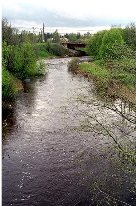
Река Сестра на граници према Финској

Вашка (605 km) је лева притока Мезења (966 km) који утиче у Бело море, а пловна је од ушћа 288 km до пристаништа Уст-Вачерга. Титовка (78 km) на полуострву Кола је кратка река са великим падом па ће њене водне снаге искоришћавати две хидроелектране. На северозападу европског дела Русије налази се још једна Кума (230 km) која истиче из Соколозера (језеро Соко), а утиче у Пја језеро (акваторија 659 km 2 , највећа дубина 49 m) и протиче даље кроз више језера, чије отоке мењају име (Софјанга, Кундозерка, Ковдочка, Иова, Ругозерка) и најзад утиче у Бело море, дајући му 271 m 3 воде у секунди. Више кратких река имају чудне називе, као да се налазе у нашој земљи: Кола, Наша, Киша, Онда, Јаја, Вага... Они немају исто значење у српском језику. Тако нпр. Кола је риба. Стари назив ове реке био је Куљјок, „рибна река“ (фински jокк значи река).